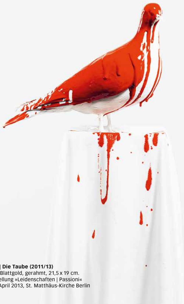
Julia Krahn | Die Taube (2011/13) Polaroid auf Blattgold, gerahmt, 21,5 x 19 cm. In der Ausstellung »Leidenschaften | Passioni« Februar bis April 2013, St. Matthäus-Kirche Berlin