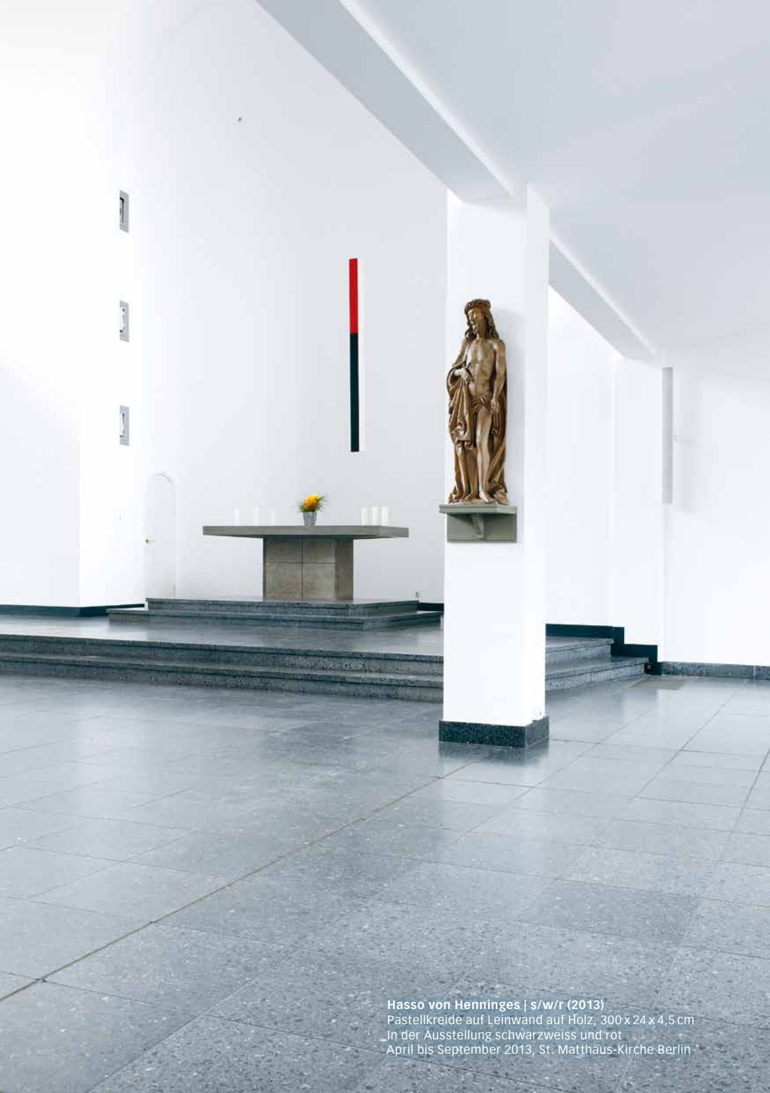
Hasso von Henniges | s/w/r (2013) Pastellkreide auf Leinwand auf Holz, 300 x 24 x 4,5 cm In der Ausstellung schwarzweiss und rot April bis September 2013, St. Matthäus-Kirche Berlin