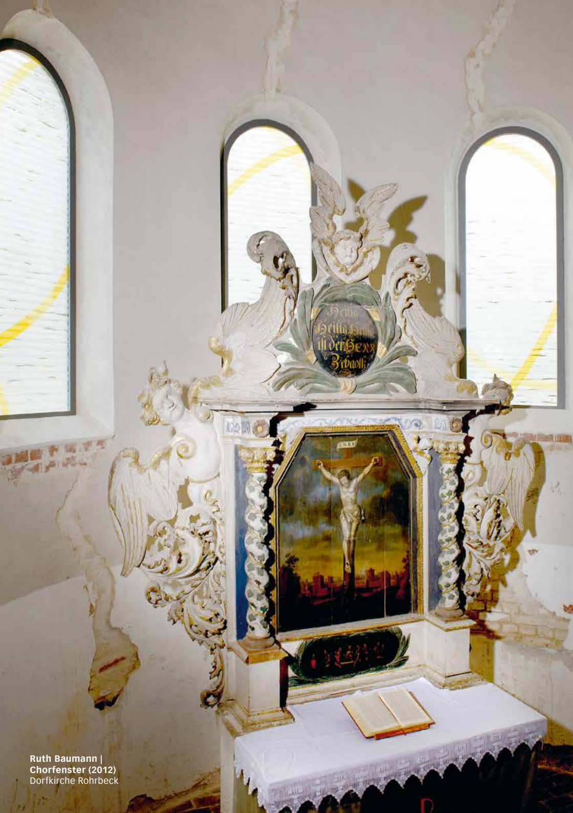
Ruth Baumann | Chorfenster (2012) Dorfkirche Rohrbeck