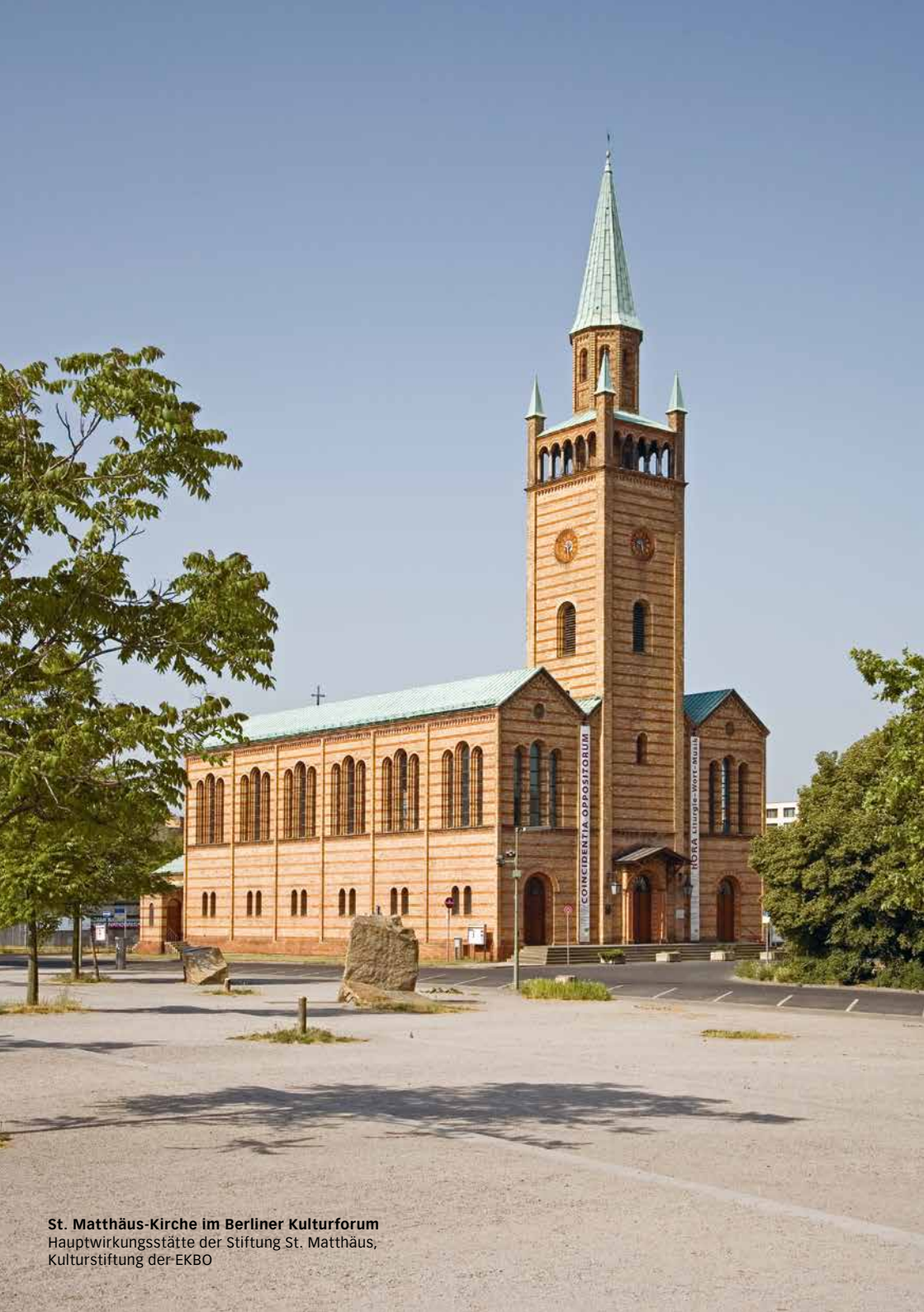
St. Matthäus-Kirche im Berliner Kulturforum Hauptwirkungsstätte der Stiftung St. Matthäus, Kulturstiftung der-EKBO