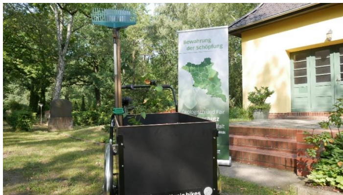
Anschaffung eines Lastenfahrrads für den Friedhofsverband Berlin Süd-Ost.

Weitere Informationen unter: www.ekbo.de/umwelt