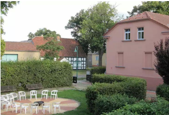
Foto: Helmut-Gollwitzer Haus

www.akd-ekbo.de/service/evangelische-haeuser