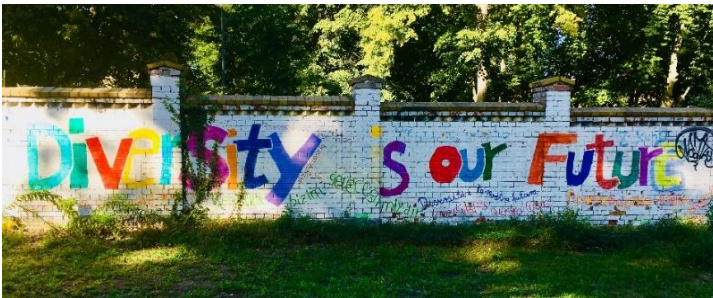
Mauer in Neuruppin

www.akd-ekbo.de/geschlechtergerechtigkeit-und-bildung-in-vielfalt