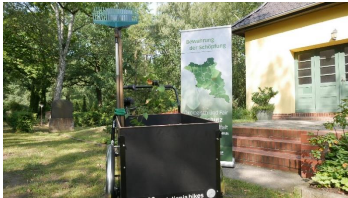
Anschaffung eines Lastenfahrads für den Friedhofsverband Berlin Süd-Ost.

Weitere Informationen unter: www.ekbo.de/umwelt