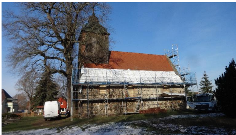
Dorfkirche Egsdorf (LDS).

Weitere Informationen unter: www.altekirchen.de