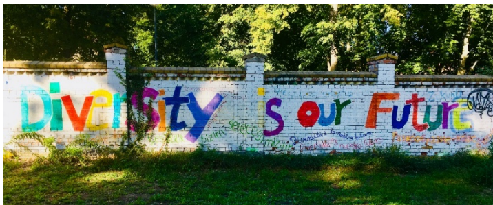
Mauer in Neuruppin, Foto: AKD/A. Rumpff

www.akd-ekbo.de/geschlechtergerechtigkeit-und-bildung-in-vielfalt