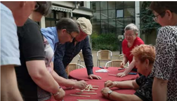
Standbild aus dem Film „EKBO: Bildung und Gesellschaft“ zum Projekt „Mit Respekt Brücken bauen“.

Weitere Informationen unter: http://eae.ekbo.de