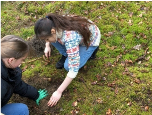
Baumpflanzaktion mit Reli-Schüler:innen

Weitere Informationen unter: www.umwelt.ekbo.de